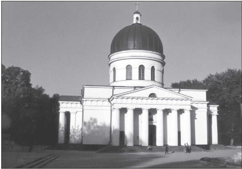
Eén van de historische bezienswaardigheden in Chisinau is de fraai gerestaureerde kathedraal

NB: dit arrangement is ook mogelijk op 17 en 24 oktober. Het wijnfestival wordt dan vervangen door een uitgebreidere dagtocht op zaterdag.